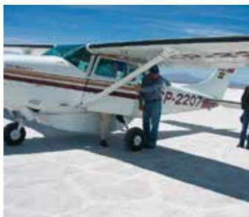
Eugén har landat planet på Salar de Uyuni 3600 m ö h. Det ser ut som snö, men det är salt.